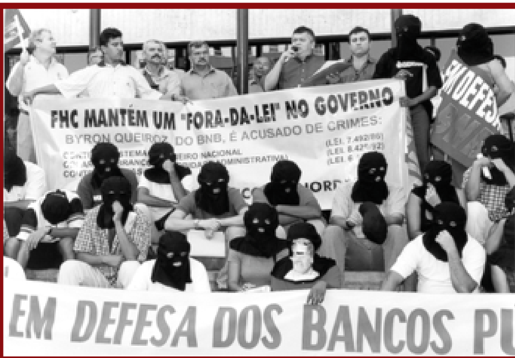
Encontro Nacional dos Bancários