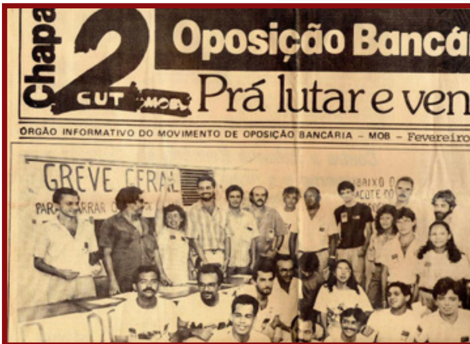
Eleições de 1989: Bancários lançam chapa de oposição para o SIND- BANCÁRIOS/RN