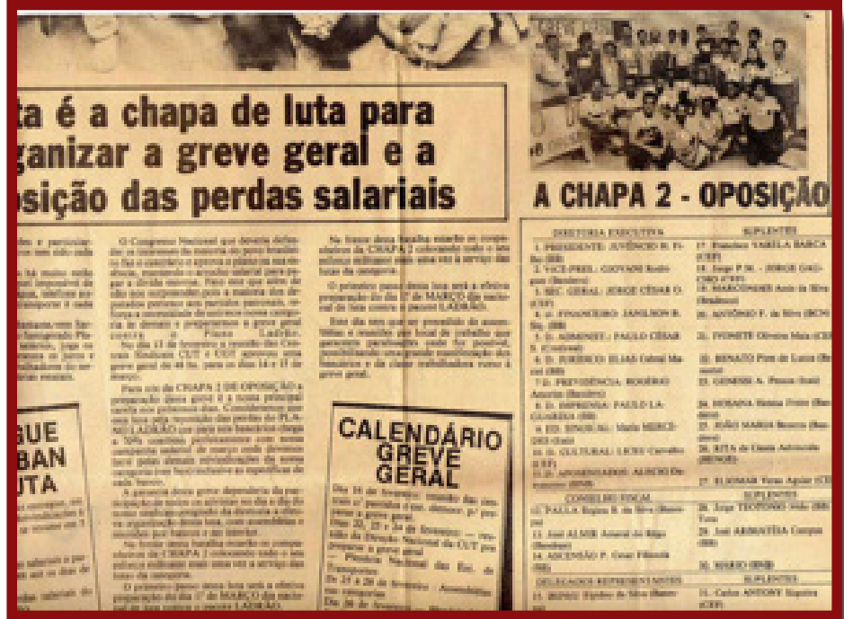
Em 1989 a oposição bancária volta a disputar as eleições do SIND-BANCAUTAS/RN