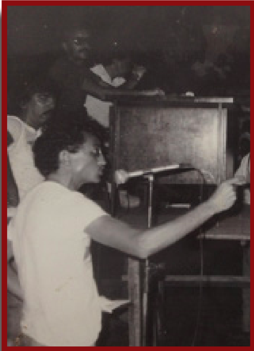
A greve em Natal na década de 80