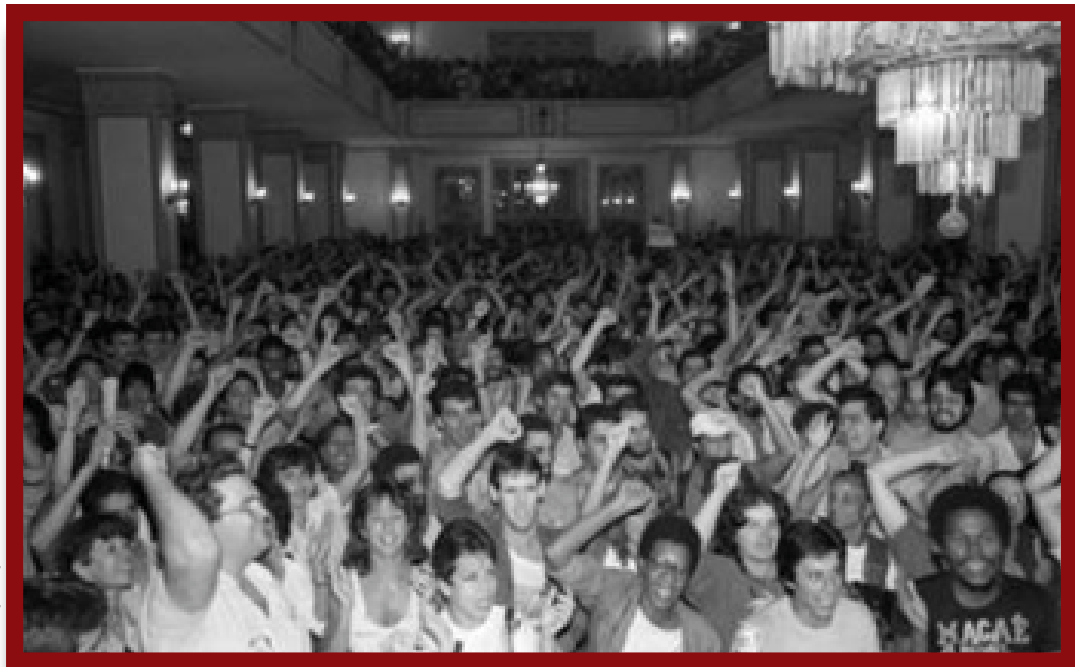
1985: Vitória da oposição Bancária no Rio

No Rio Grande do Norte, o Sindicato era influenciado pelo PCB que tinha um alinhamento com o sindicalismo pelego que deu origem a CGT e que se contrapunha a construção da CUT.