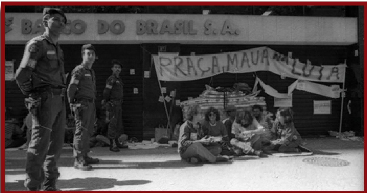
A Greve de 1985 fechou 90% das agências bancárias no Rio de Janeiro.